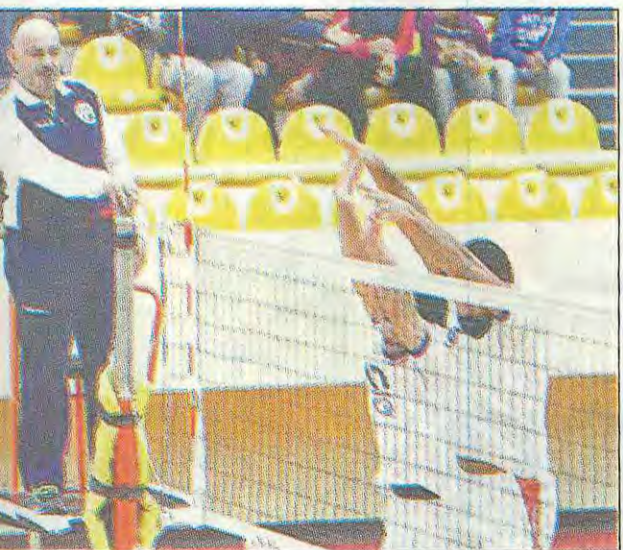
• طائرة الكويت مع القادسية في لقاء