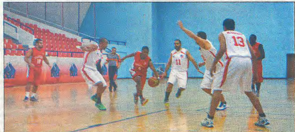
• سلة الكويت مع الصليبيخات في لقاءهما بالدوري

في اطار لعبة الكراسي الموسيقية استعاد الكويت صدارة دوري الدمج لفرق الدرجة الاولى لكرة السلة بشكل مؤقت اثر تغلبه على الصليبيخات في المباراة التي جرت بينهما مساء امس الاول ضمن لقاءات