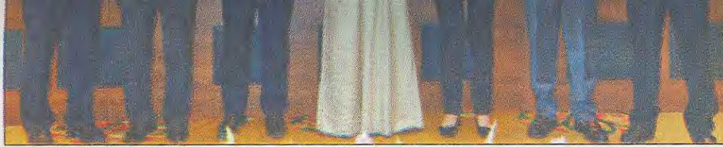
• الشيخ أحمد النواف يتوسط أعضاء المكتب التنفيذي للاتحاد الدولي للشرطة

الشيخ محمد خالد على الكريمة لاجتماعات الجعومية للاتحاد الدولي للشرك كما تقدم بالشكر الى وكيل والداخلية الفريق سليمان القهد دعمه للرياضة الشرطة سواء المستوى المحلي او العربي الدولي.