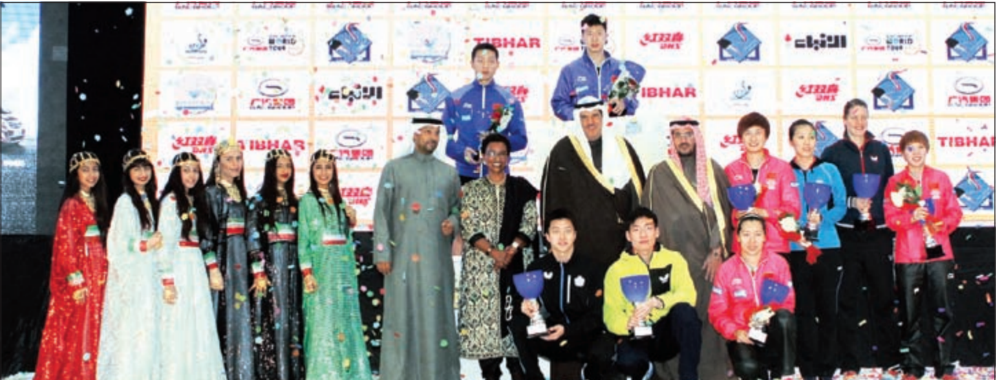
وزير الإعلام والشباب الشيخ سلمان الحمد والشيخة نعيمة الأحمد والشيخ دعيج فهد الدعيج وحمود الديحاني في ختام البطولة الماضية

الدولي للعبة. وتقسّم بطولة كأس سلوى ذات التصنيف العالمي الأول في منح الجوائز لسيدات، وزوجي رجال وسيدات، وتحت 21 سنة للشباب وللشابات. ويقوم بتحكيم مباريات البطولة 15 حكماً دولياً من الكويت و25 حكماً من خارج الكويت، على أن تلعب المباريات بنظام خروج المغلوب في جميع الفئات وتبدأ المباريات يومياً الساعة العاشرة صباحاً حتى العاشرة ليلاً.